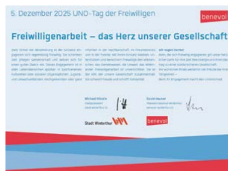
Inserat im Landboten, Tag der Freiwilligen, 05.12.25

Zusammen mit der Stadt Winterthur und dem Stadtpräsidenten Mike Künzle veröffentlichte benevol Winterthur zum Tag der Freiwilligen am 5. Dezember 25 ein grosses Dankesinserat im Landboten.