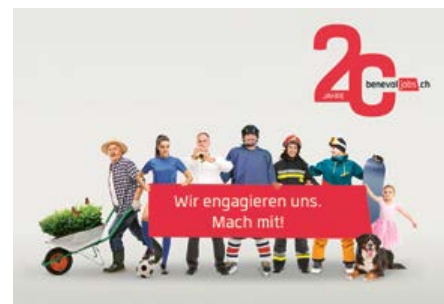
benevol-jobs.ch blickt 2025 auf ein starkes Jubiläumsjahr zurück: Rekordzahlen bei Freiwilligen und 20 Jahre Engagement für die Schweiz