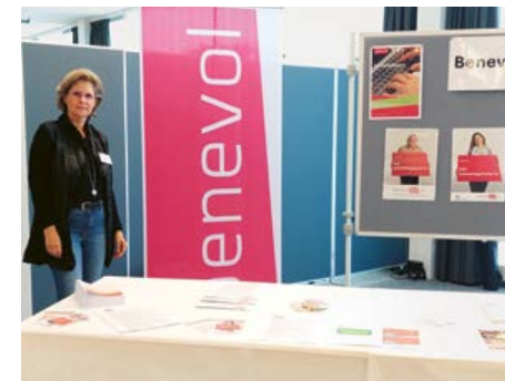
SVE Tagungen im November 25